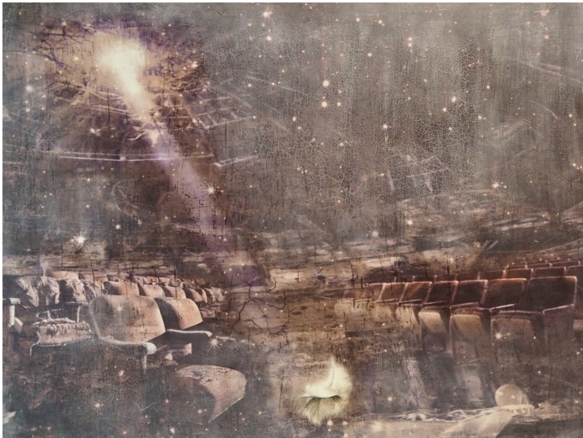
MORGENLYSETS GJENNOMBRUDD Oljetempera på plate | 122 x 162 cm

kr 89 250,- Pris inklusive 5% BKH-avgift