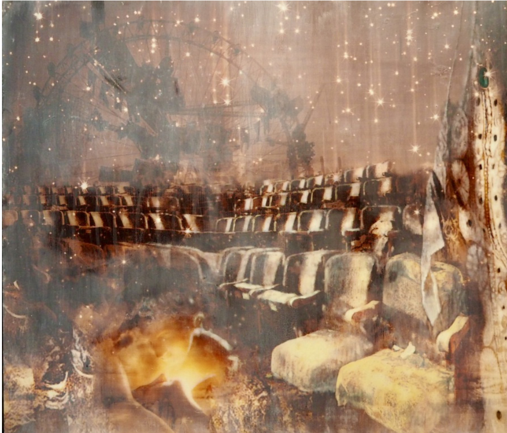
KYSS Oljetempera på plate | 122 x 140 cm

kr 81 900,- Pris inklusive 5% BKH-avgift