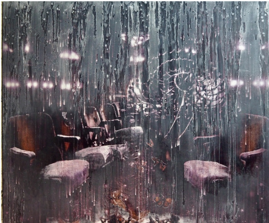
SOLEN SKAL SMELTE DUGGET FRA RUTEN Oljetempera på plate | 122 x 140 cm

kr 81 900,- Pris inklusive 5% BKH-avgift