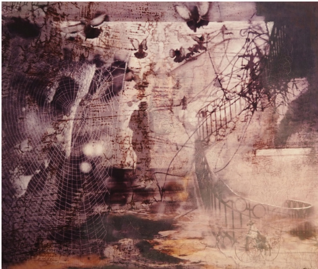
TRINN FOR TRINN MOT LYSET Oljetempera på plate | 103,5 x 122 cm

kr 59 850,- Pris inklusive 5% BKH-avgift