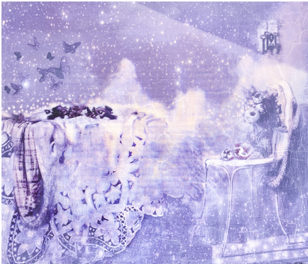
LYS FRA VINTERHIMMEL Oljetempera på plate | 103,5 x 122 cm

kr 59 850,- Pris inklusive 5% BKH-avgift