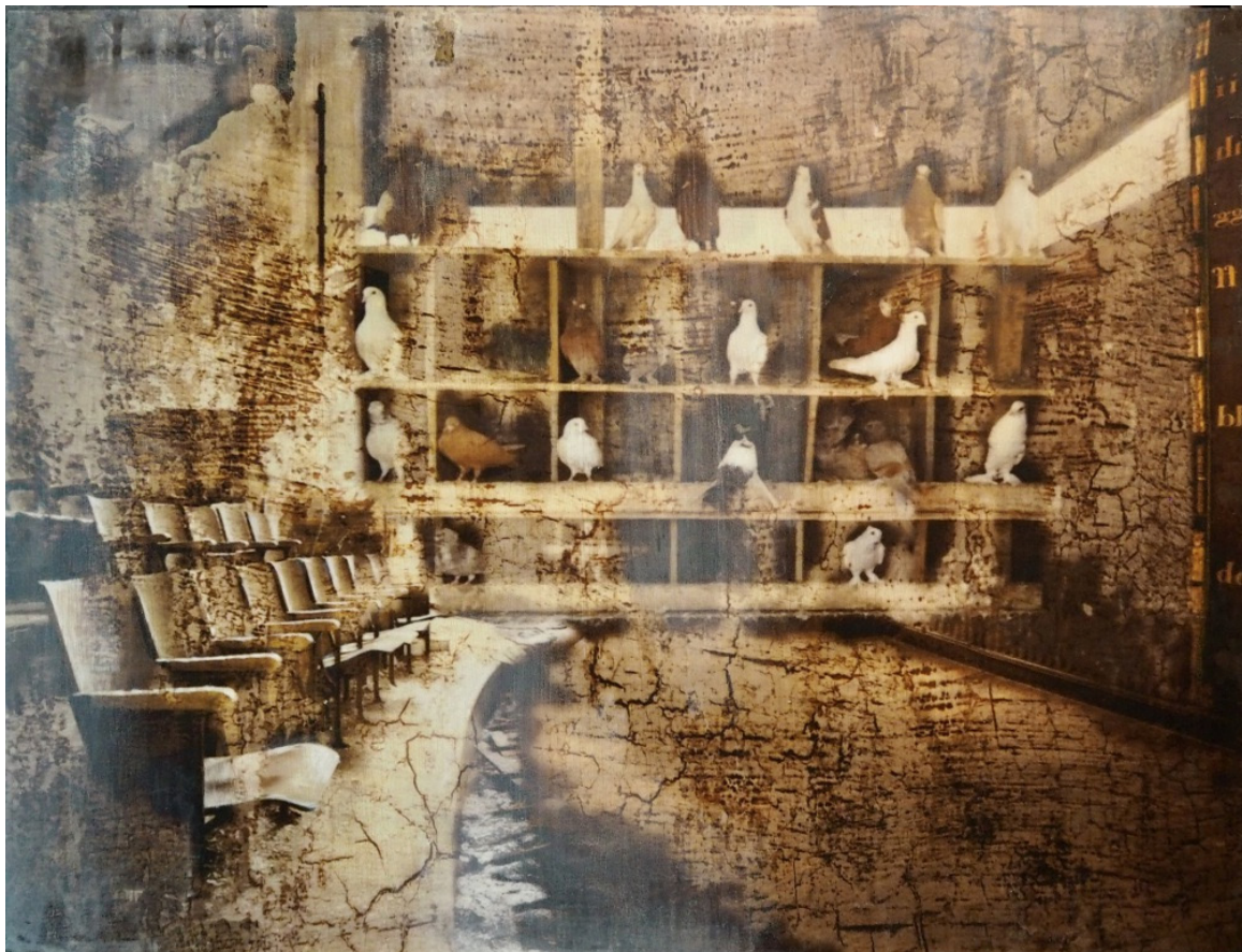
FUGLESANGEN STILNER ALDRI Oljetempera på plate | 122 x 160 cm

kr 89 250,- Pris inklusive 5% BKH-avgift