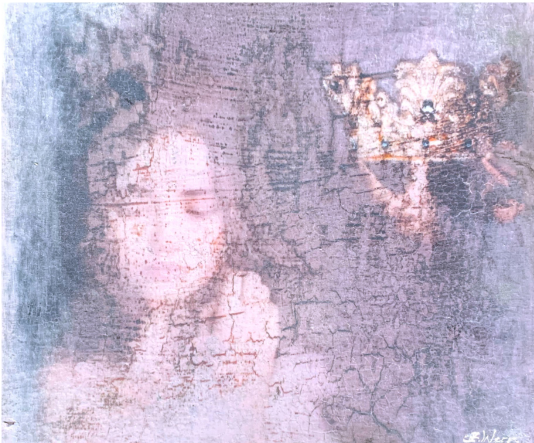
VIL KRONE DEG 2 Oljetempera på plate | 38 x 45,5 cm

kr 27 300,- Pris inklusive 5% BKH-avgift