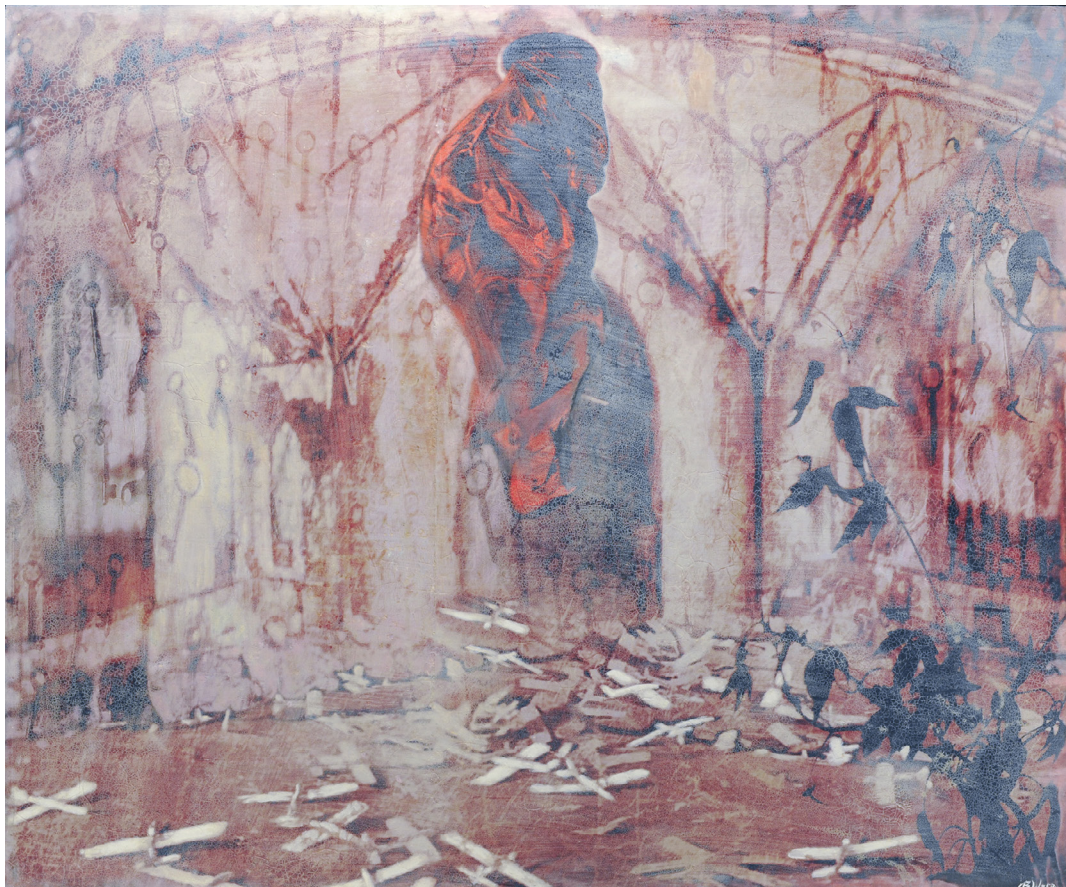
LIDENSKAPENS VENDEVÆRELSE Oljetempera på plate | 130 x 157 cm

kr 90 300,- Pris inklusive 5% BKH-avgift