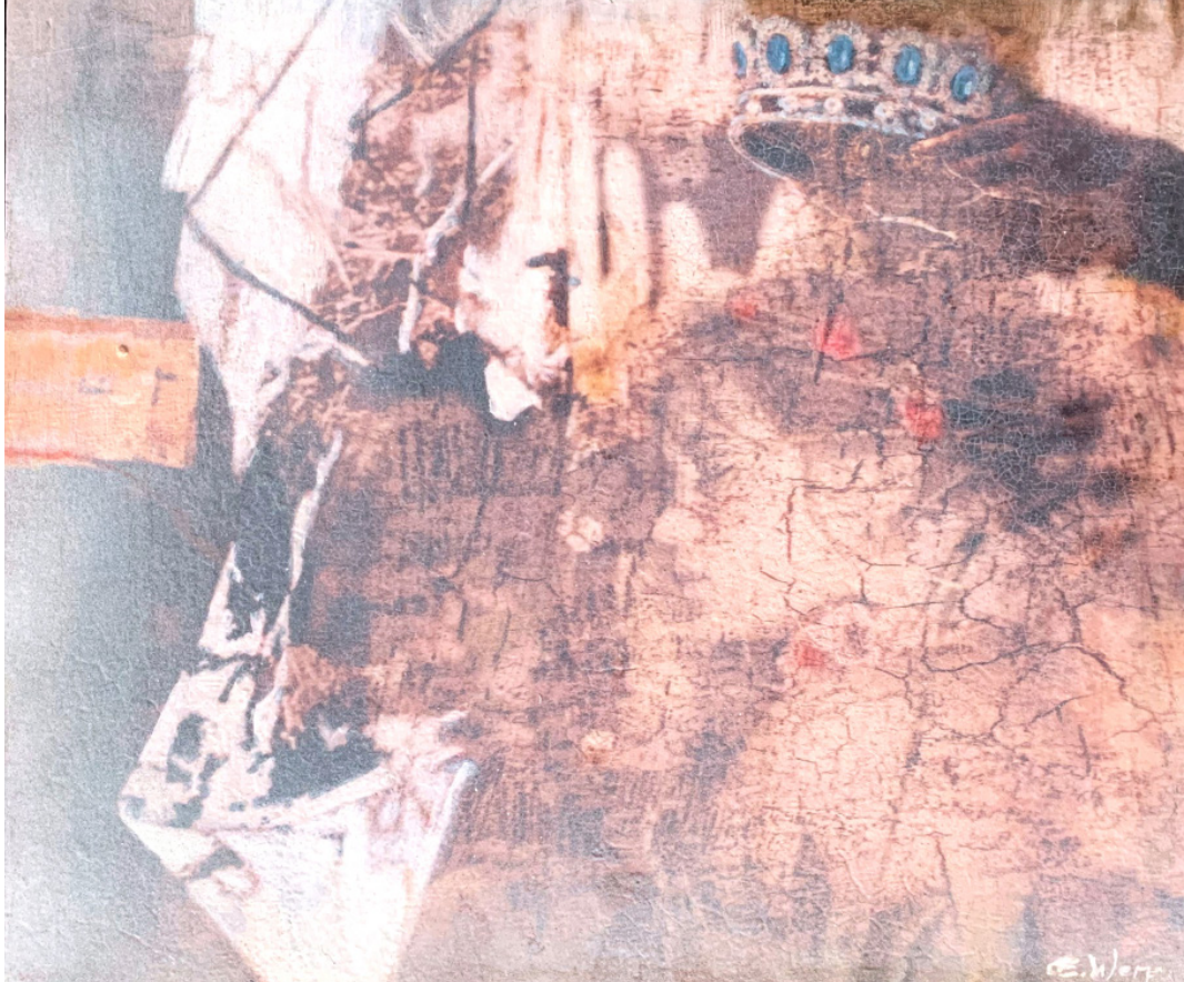
VIL KRONE DEG 1 Oljetempera på plate | 38,5 x 46 cm

kr 27 300,- Pris inklusive 5% BKH-avgift