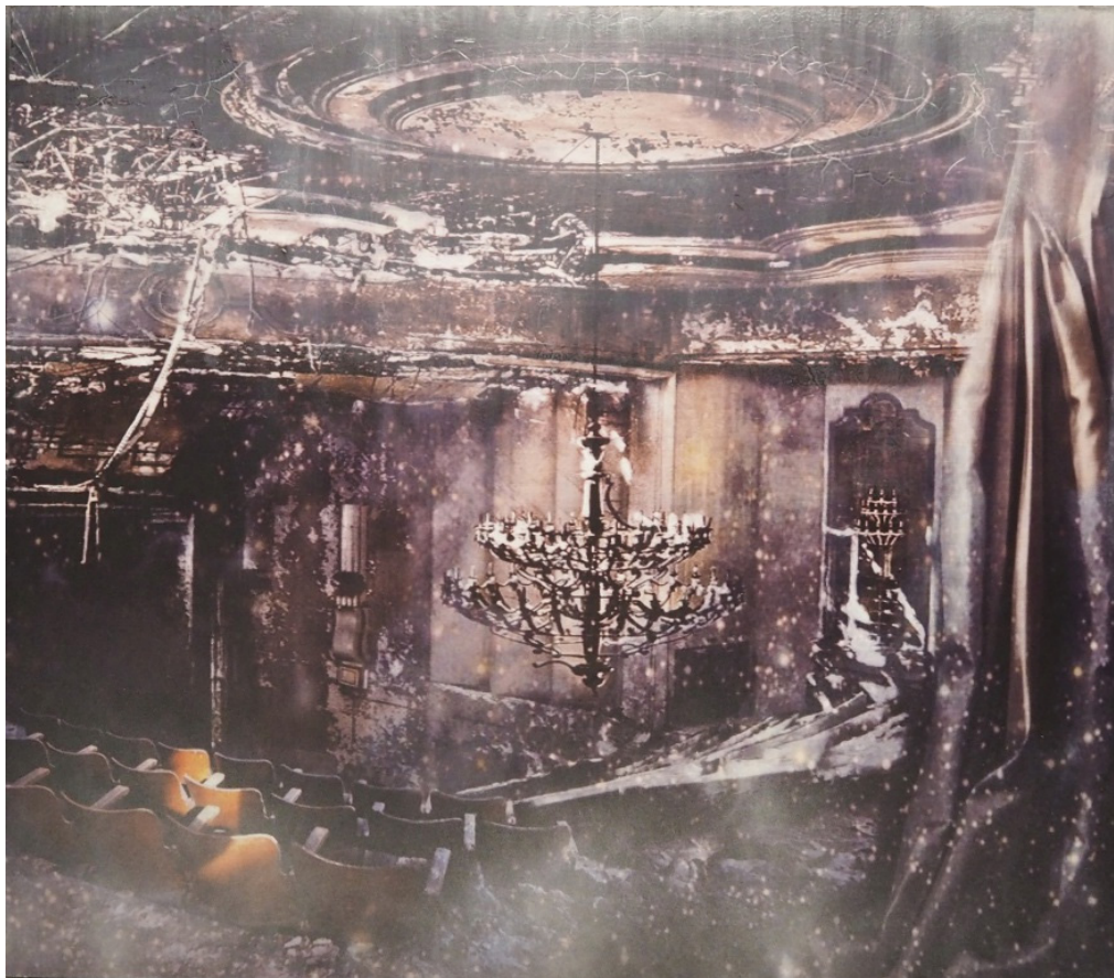
LYS OG MØRKE, MØRKE OG ATTER LYS Oljetempera på plate | 122 x 140 cm

kr 81 900,- Pris inklusive 5% BKH-avgift